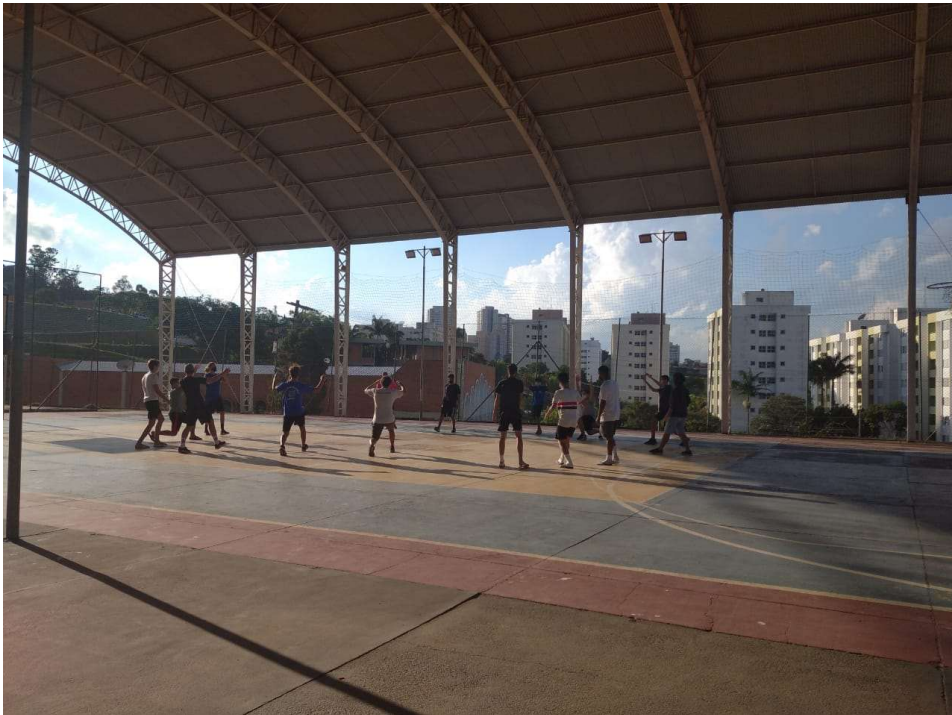
Imagem 5 – quadra poliesportiva com atividade “seca”