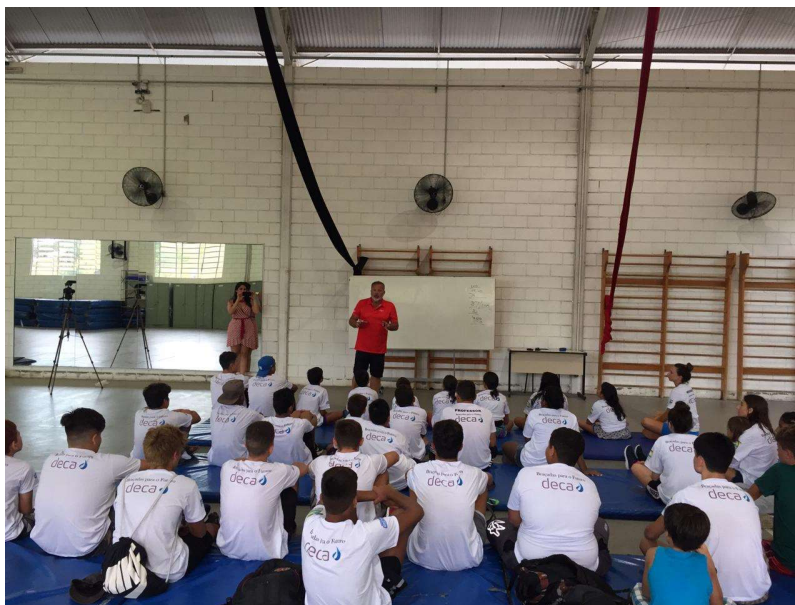
Imagem 4 – sala de ginástica com oficina