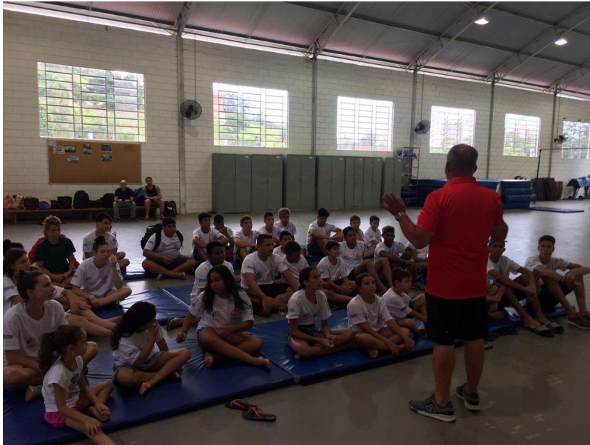
Imagem 3 – sala de ginástica com oficina