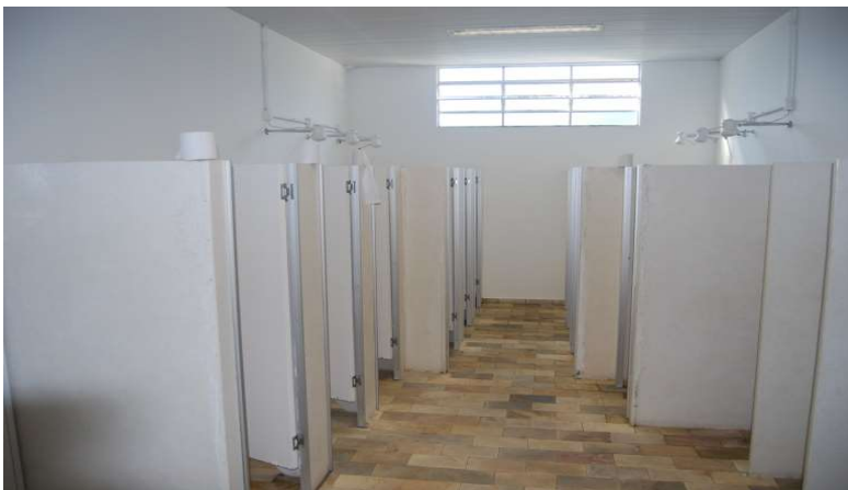
Imagem 1 – Vestiários do Conjunto Aquático Uniachieta