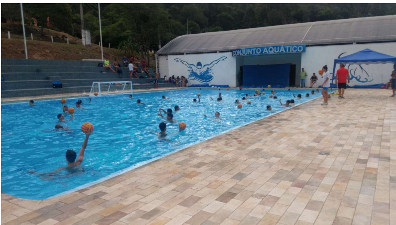
Imagem 2 – Piscina com atividade de polo aquático