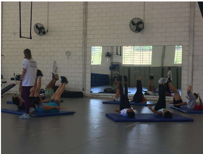
Imagem 6 – sala de ginástica com atividade “seca”