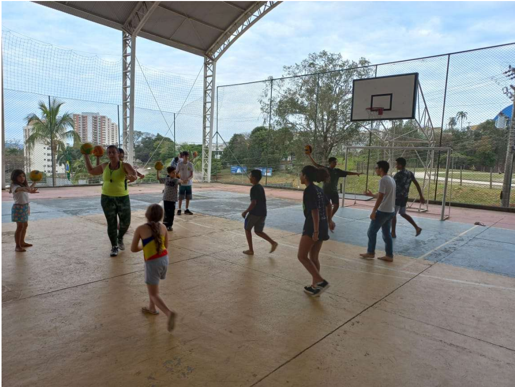
Aula de condicionamento físico na quadra poliesportiva.