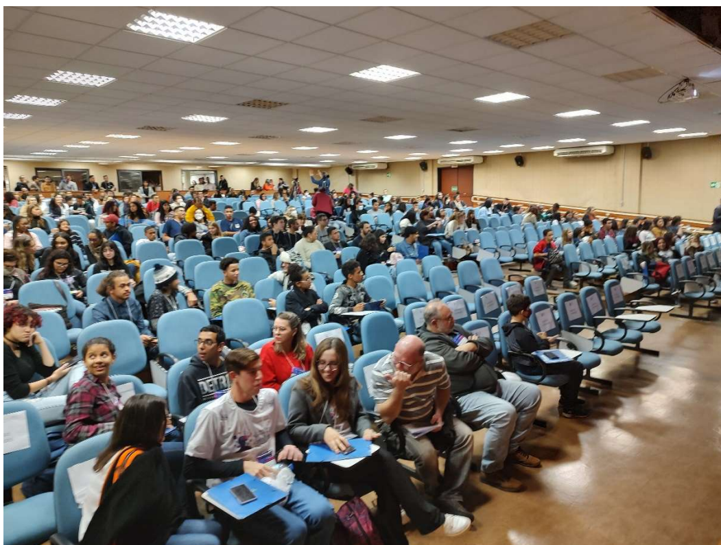
I Conferência Intermunicipal de Juventude de Jundiaí, 12/08/2022, UNIP.