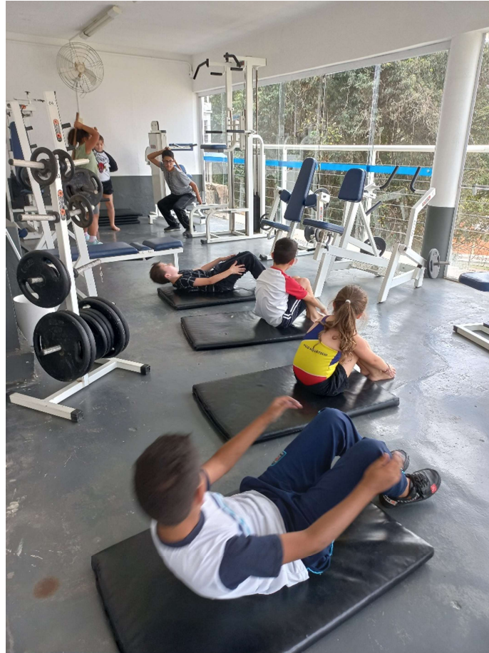
Condicionamento físico dos alunos na academia.