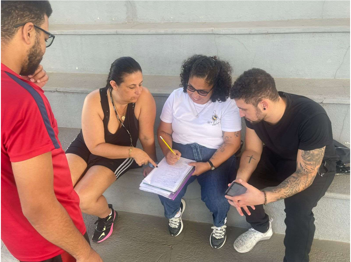
Reunião da equipe para discussão dos casos e a organização, escalação e preparo dos atletas sub 13 para o Festival Habawaba em 23/09.