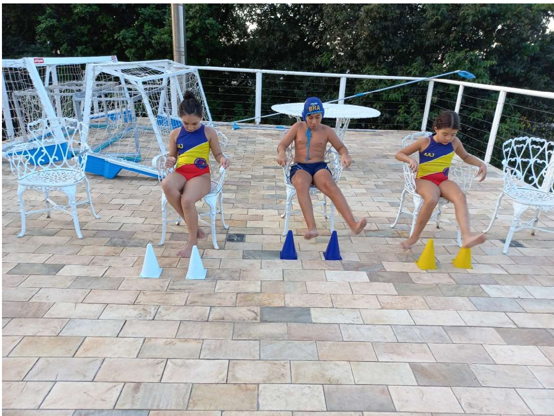
Atividade seca: treinando perna de polo em 14/09.