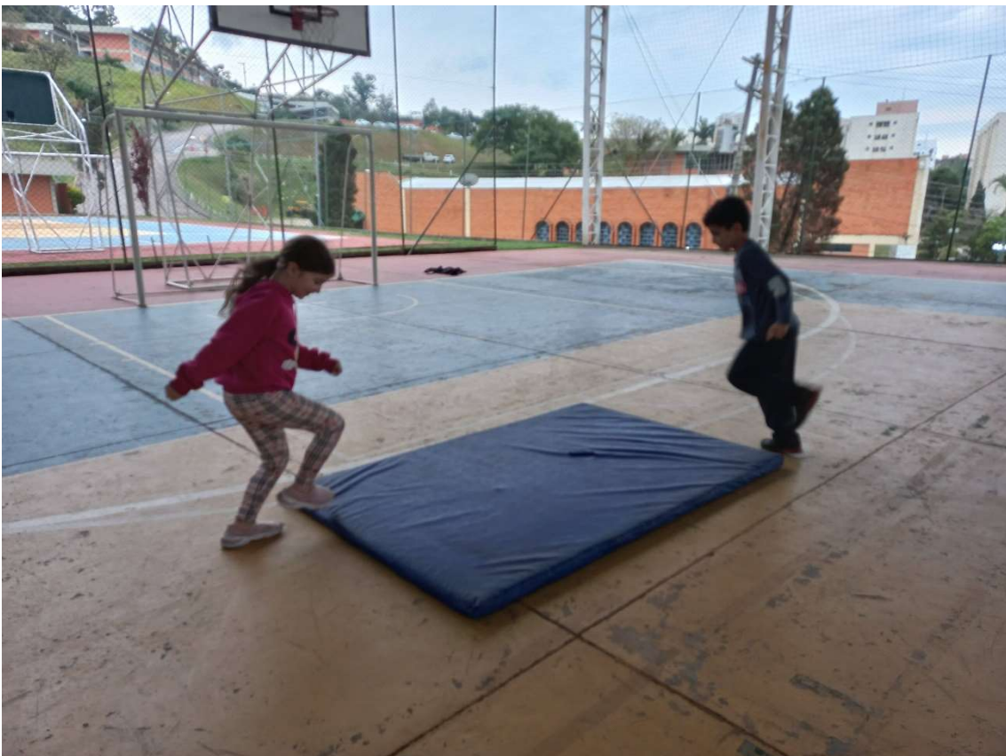
Atividades secas realizadas na quadra, sempre antes das aulas na piscina.