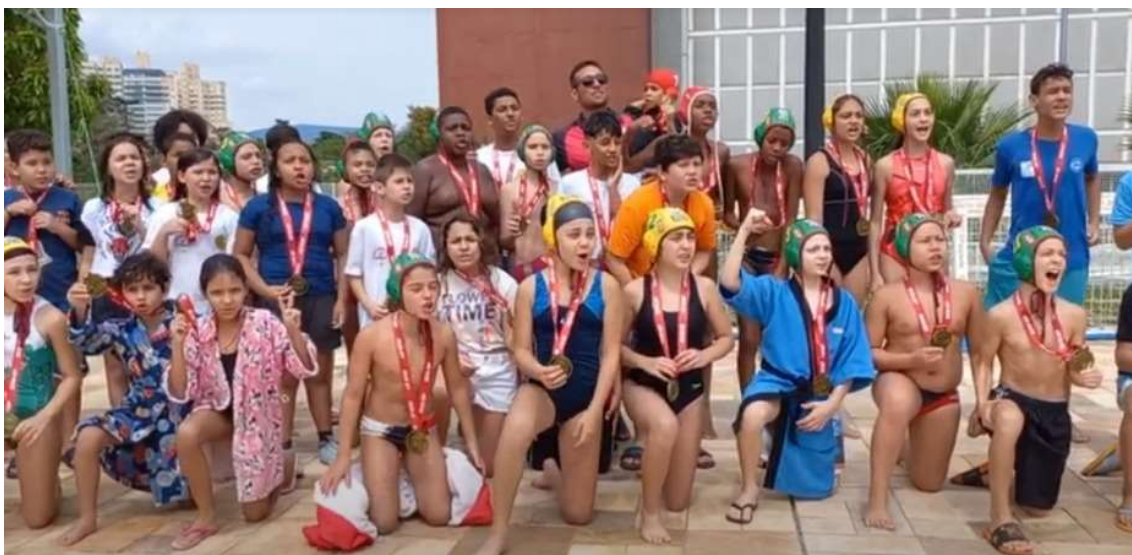
FESTIVAL SESI JUNDIAÍ DE POLO AQUÁTICO.15/10 Atletas da AAJ, Clube Jundiaiense e Sesi Jundiaí ao final dos jogos do FESTIVAL SESI JUNDIAÍ de Polo Aquático em 15/10.