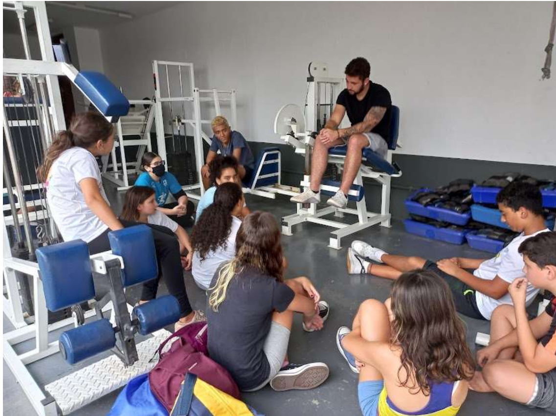
Feedback dos alunos sobre a participação no Festival Sesi Jundiaí em 17/10.