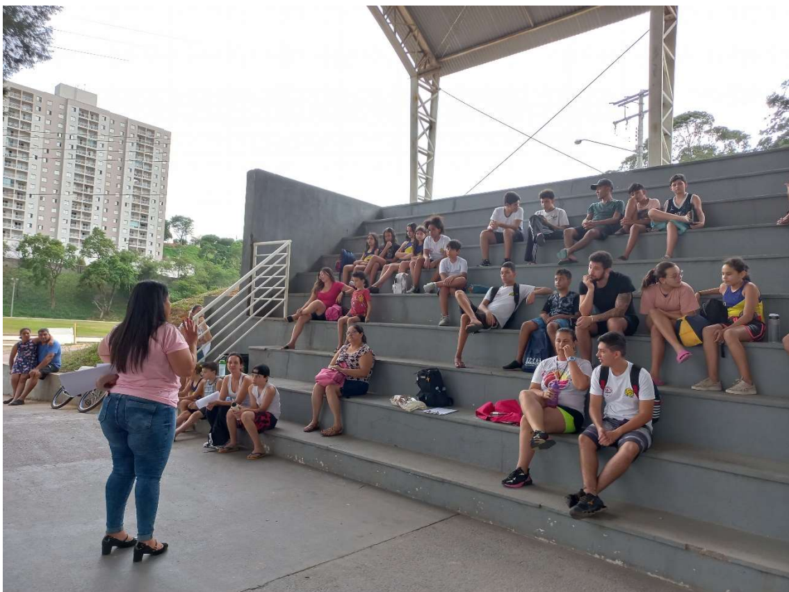
27/10 Alunos, pais e professores ouvindo sobre o tema Outubro Rosa.