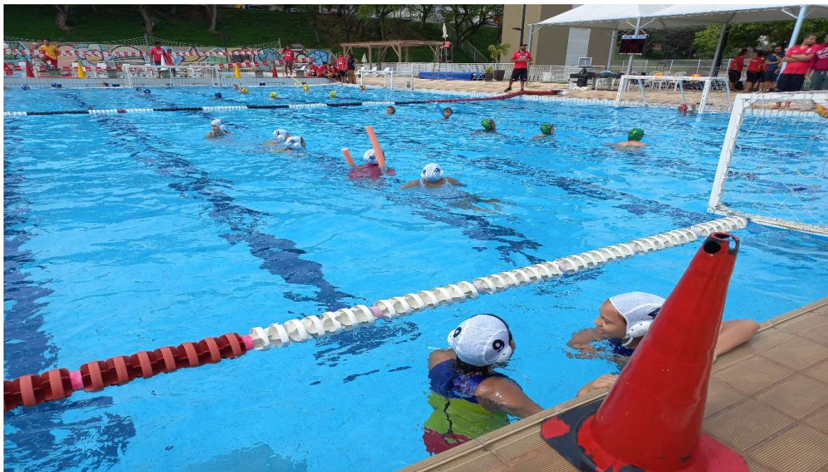
15/10 FESTIVAL SESI JUNDIAÍ DE POLO AQUÁTICO.