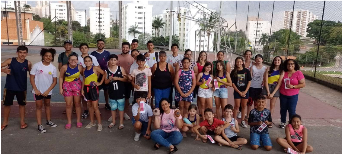
27/10 Alunos e mães após a palestra sobre Outubro Rosa.

Rua Dr. Wellington Barbosa Martins, 106, Chácara Malota, CEP. 13.211-500, Jundiaí, SP Fone: 11 – 98514-0033 | e-mail: aajundiai@hotmail.com | CNPJ: 10.557.670/0001-67