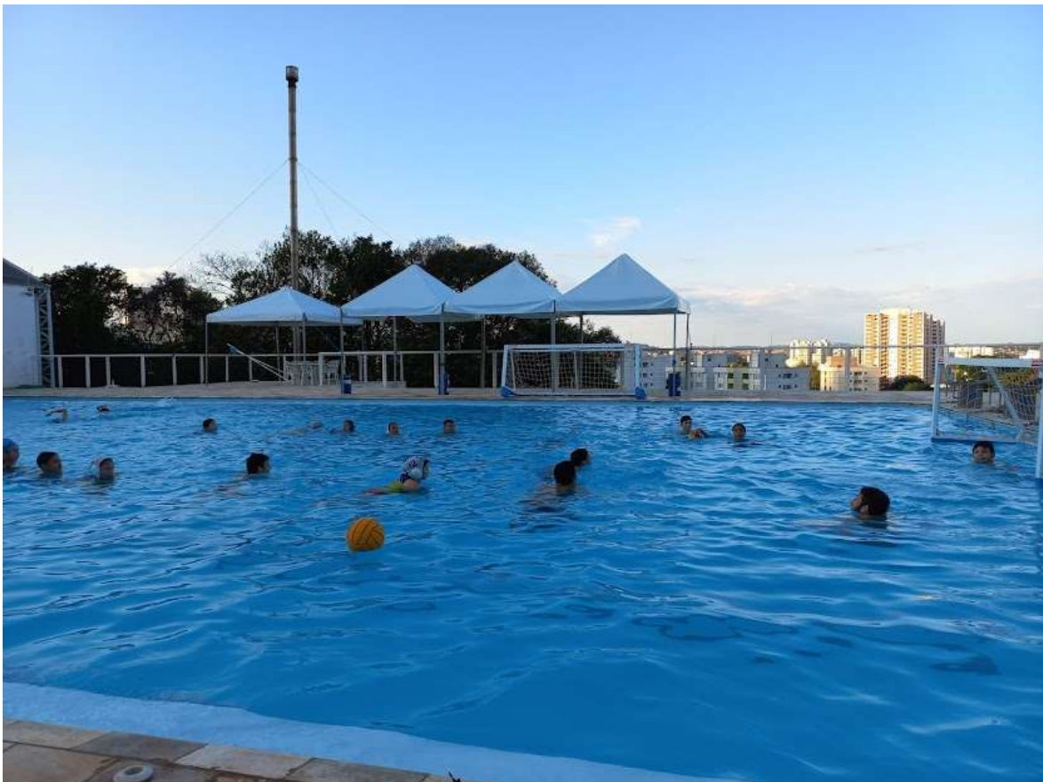
Treino de passe com bola