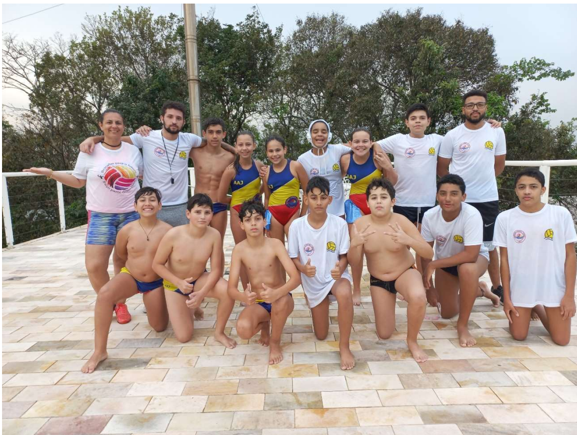
17/10 Foto oficial do Time Braçadas-AAJ que irá participar do Festival Habawaba de 07 a 11/12