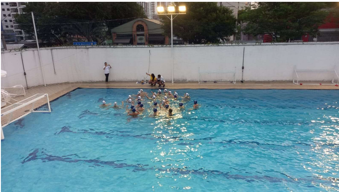
Jogo Treino no Clube Jundiaiense em 28/10.