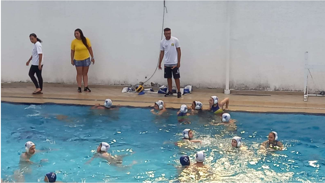
Jogo Treino no Clube Jundiaiense em 28/10.