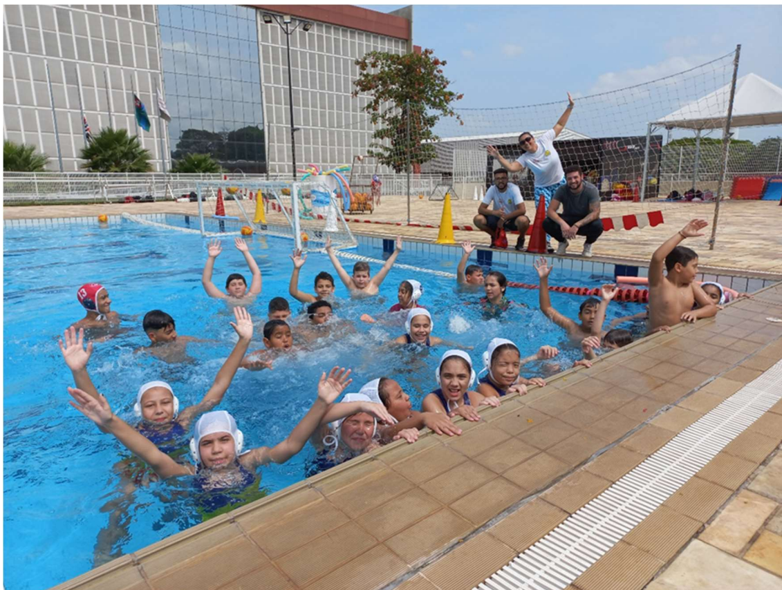
Participação dos ossos alunos no FESTIVAL SESI JUNDIAÍ de Polo Aquático em 15/10.

Rua Dr. Wellington Barbosa Martins, 106, Chácara Malota, CEP. 13.211-500, Jundiaí, SP Fone: 11 – 98514-0033 | e-mail: aajundiai@hotmail.com | CNPJ: 10.557.670/0001-67