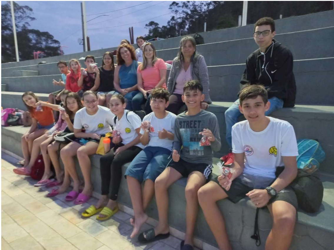
17/10 Entrega de kit de doces para nossos alunos e alunas em comemoração ao Dia das Crianças.