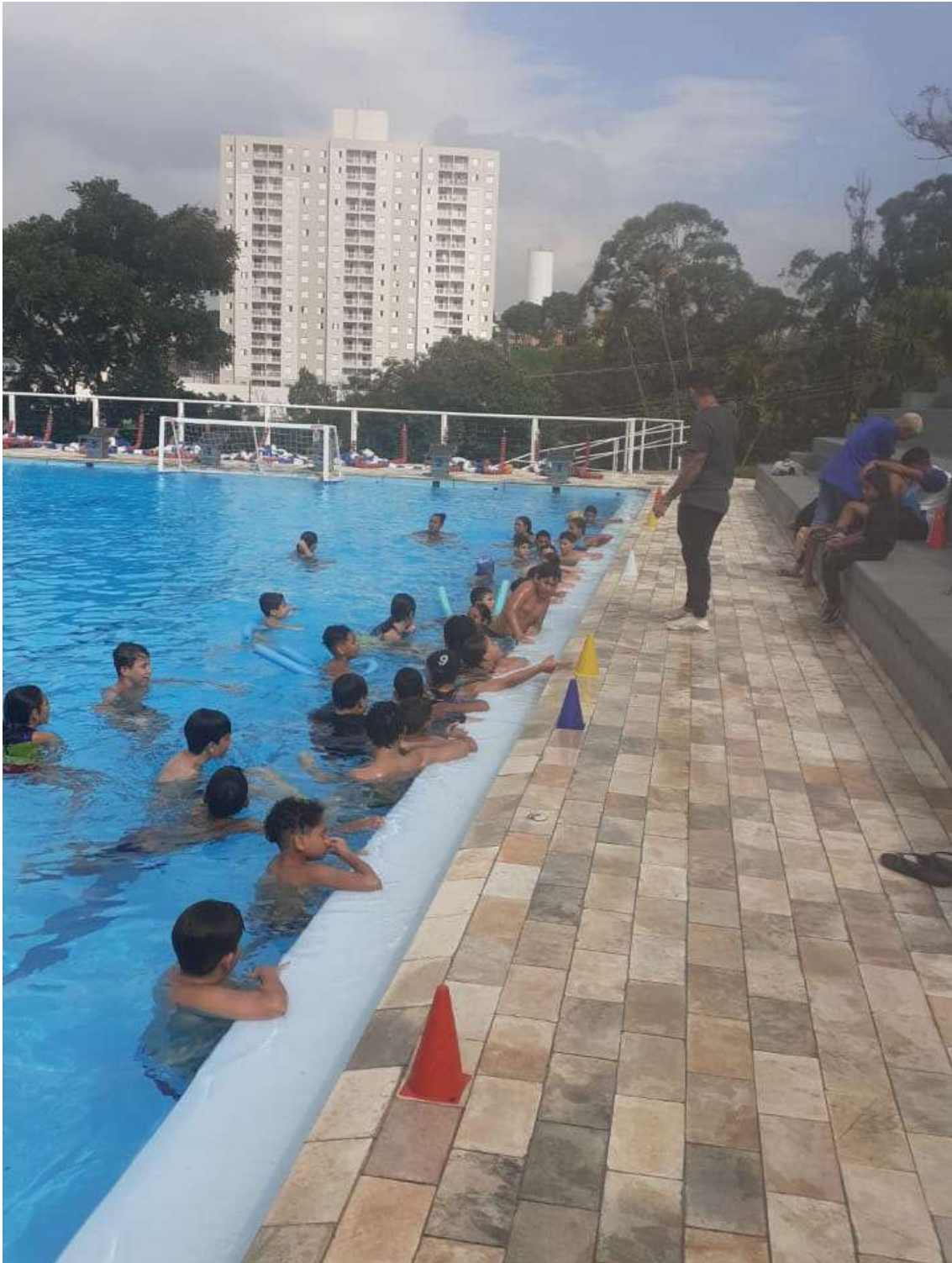
Aprendendo o significado dos cones no jogo de polo aquático.