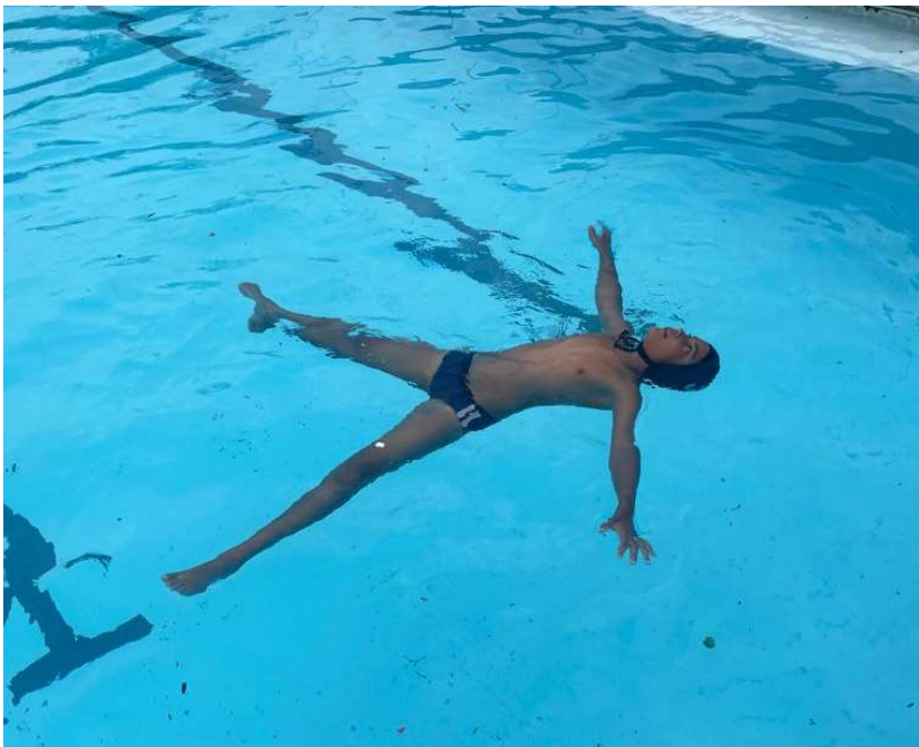
Aprendendo a flutuar.