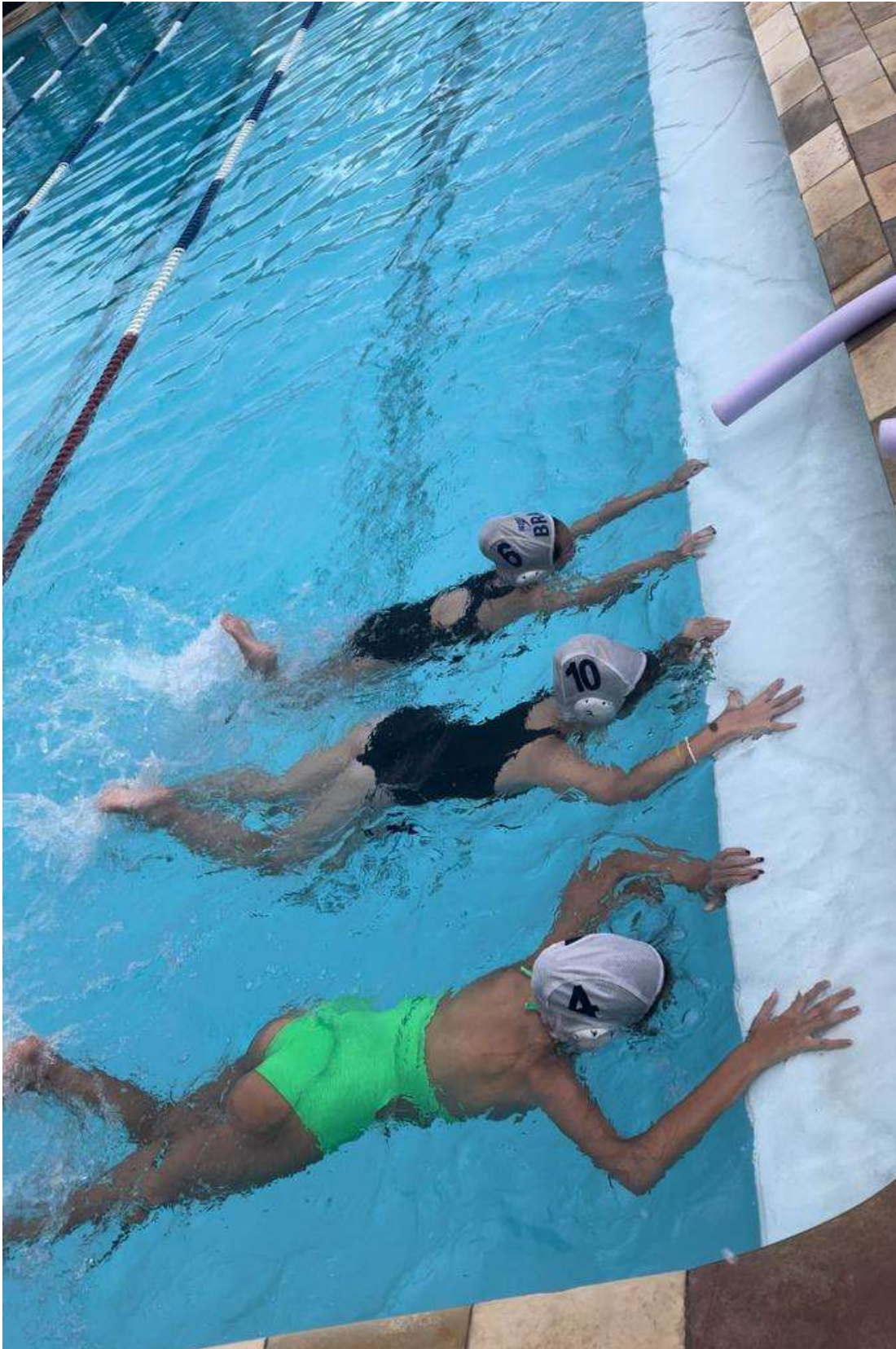
Treino de nado crawl.

Rua Dr. Wellington Barbosa Martins, 106, Chácara Malota, CEP. 13.211-500, Jundiaí, SP Fone: 11 – 98514-0033 | e-mail: aajundiai@hotmail.com | CNPJ: 10.557.670/0001-67