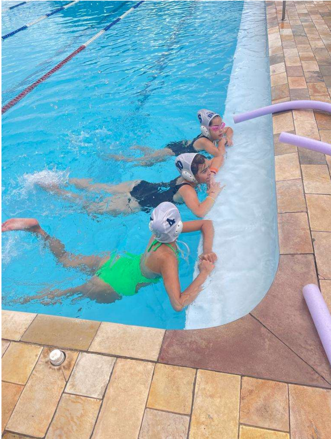
Treino de nado crawl.

Rua Dr. Wellington Barbosa Martins, 106, Chácara Malota, CEP. 13.211-500, Jundiaí, SP Fone: 11 – 98514-0033 | e-mail: aajundiai@hotmail.com | CNPJ: 10.557.670/0001-67