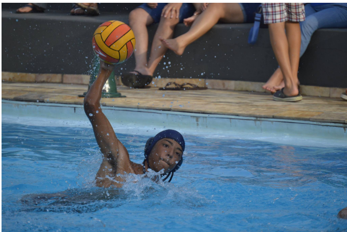
Aluno durante a participação de jogo da 1ª Liga Jundiaense de Polo Aquático.