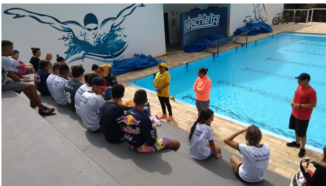
Oficina Educação e Mobilidade: Cuidados com o Trânsito ministrada pela equipe da Unidade de Gestão de Mobilidade Urbana.