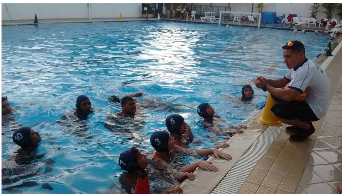
Participação dos atletas no 2º Etapa de Jogos no Clube Jundiaíense.