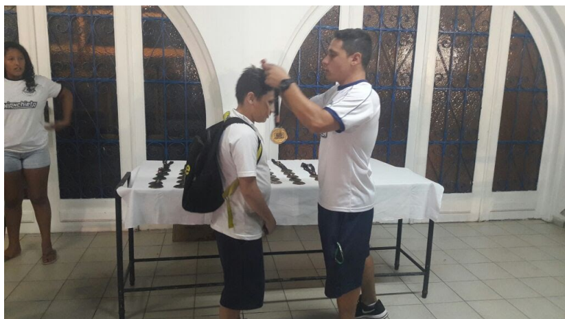
Entrega de medalhas na Final do Campeonato da 1ª Liga Jundiaense de Polo Aquático.