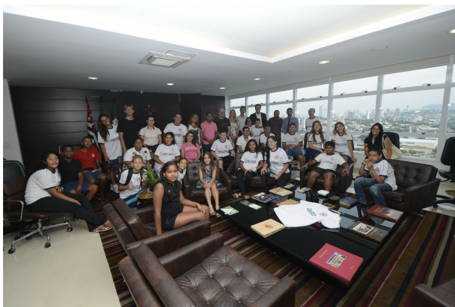
Visita dos alunos e pais ao Paço Municipal de Jundiaí.