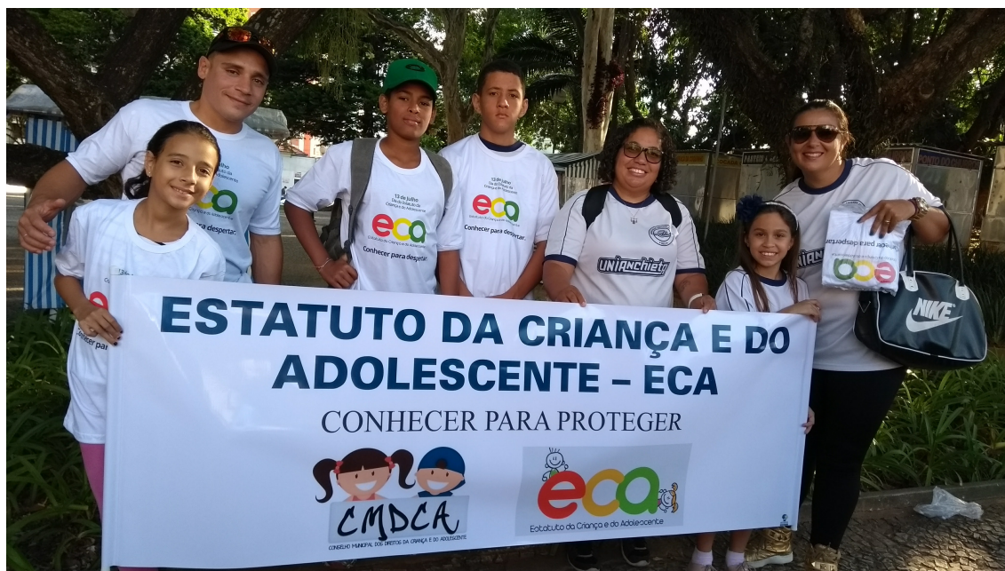
Participação de alunos na 1ª Caminhada em Comemoração aos 27 anos do ECA (Evento promovido pelo CMDCA)