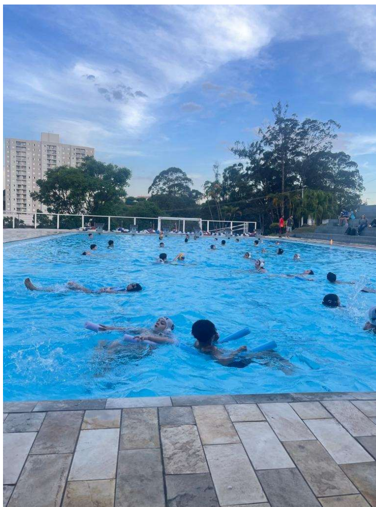
Aulas de natação e polo aquático do projeto.