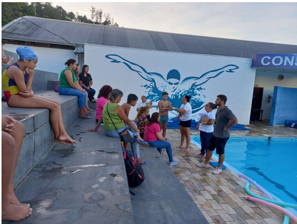
Reunião de pais dos atletas convocados para o Habawaba em 01/12/2022.