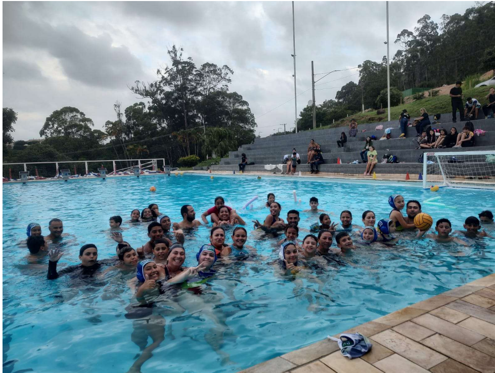
Final do Jogo PAIS X FILHOS - 20/12/2022.